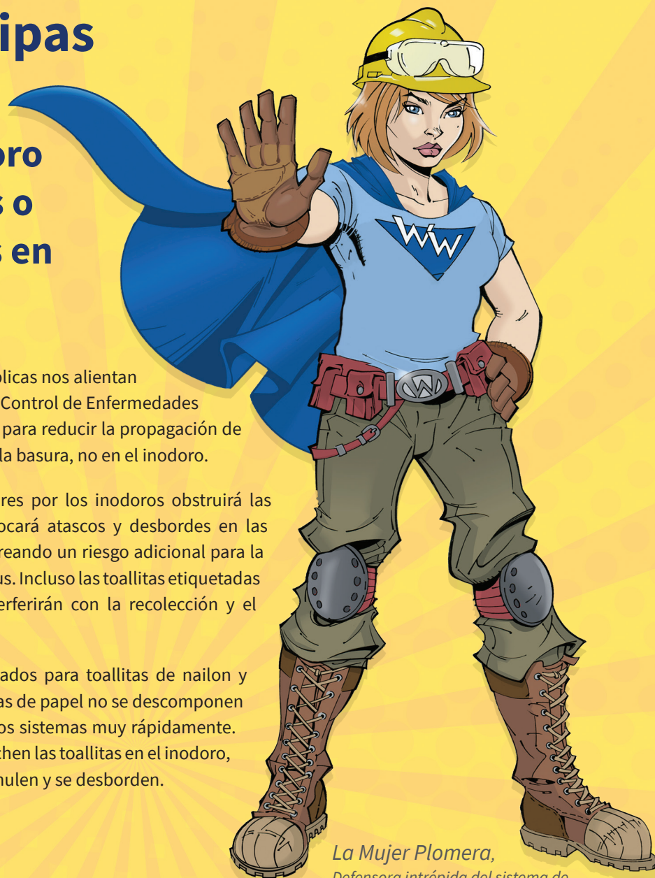
La Mujer Plomera, Defensora intrépida del sistema de drenaje alcantarillado

Los sistemas de aguas residuales no fueron diseñados para toallitas de nailon y toallas de papel individuales. Las toallitas y las toallas de papel no se descomponen como el papel higiénico y, por lo tanto, obstruyen los sistemas muy rápidamente. Las instalaciones piden a los residentes que no desechen las toallitas en el inodoro, sino que las tiren a la basura para evitar que se acumulen y se desborden.